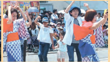
▲写真は前回、5月12日の楽市パフォーマンスのナップ。