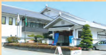
(砥部焼伝統産業会館)

「とべ楽市」開催予定月 奇数月の(1・3・5・7・9・11月) 第2日曜日に開催!