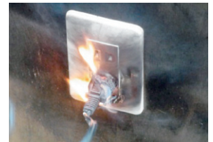
トラッキング火災の様子。

コンセントに差込プラグを長期間差し込んだ状態にしておくと、コンセントと差込プラグの間にほこり等が付着し、付着したほこり等に湿気が帯び、通電することにより火災になることがあります（トラッキング火災）。